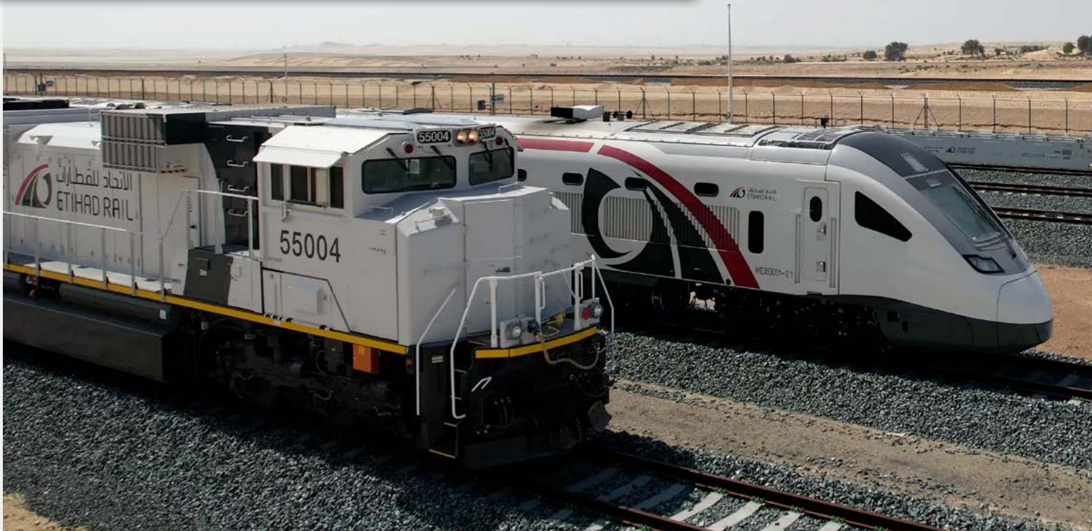
Train de fret et de passagers d'Etihad Rail