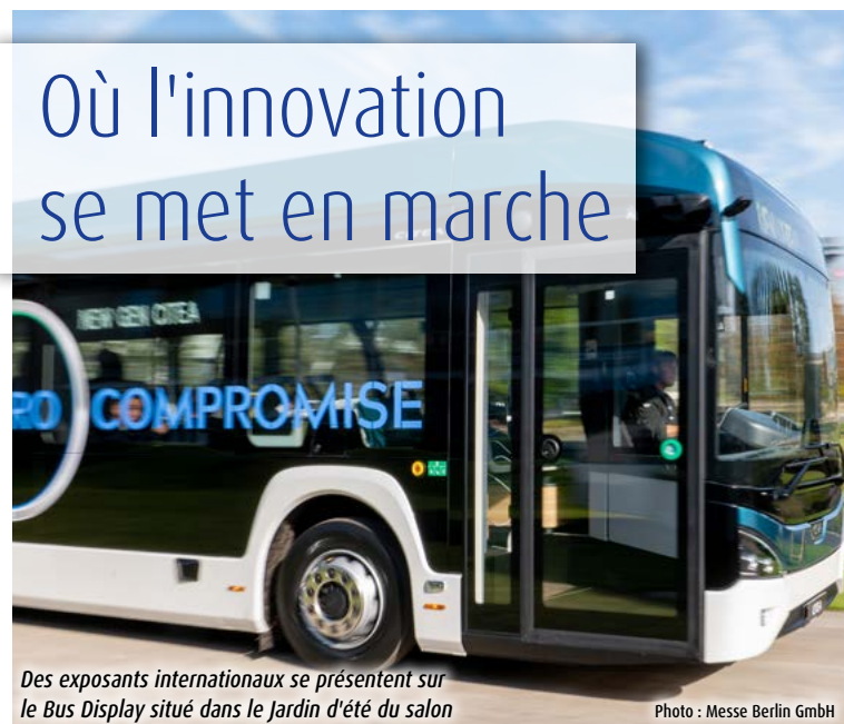
Des exposants internationaux se présentent sur le Bus Display situé dans le Jardin d'été du salon