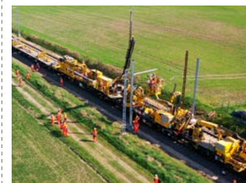
Train haute performance TSO sur le réseau 25 000 volts