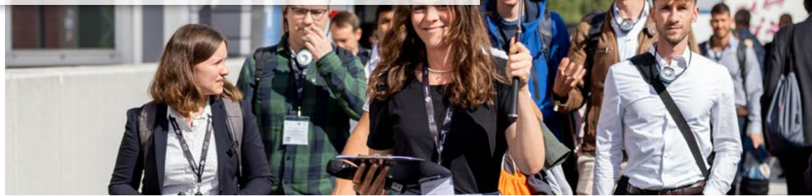
Des visites guidées mettent en contact les candidats potentiels avec les entreprises exposantes