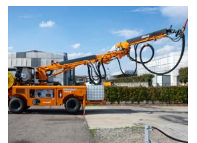
Des caractéristiques inspirées de la nature

Pour CIFA, la nature est la source d'inspiration de la gamme de constructions souterraines. « Nous avons donné aux modèles des noms d'animaux ayant des caractéristiques physiques ou comportementales similaires », a expliqué Davide Cipolla, CEO de CIFA. Selon lui, l'objectif de CIFA est de concevoir des machines aussi écologiques que possible, de respecter l'environnement et les personnes et de transformer le chantier souterrain en un écosystème durable. Dans un espace clos avec une mauvaise ventilation, les fabricants de tunneliers devraient travailler ensemble pour créer un chantier durable dans un environnement déjà très difficile. « Nous devons développer des machines intelligentes qui utilisent les données pour améliorer l'efficacité énergétique, utiliser l'électricité pour réduire les émissions et envisager une technologie qui simplifie le travail des opérateurs », a-t-il poursuivi.