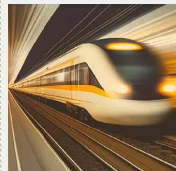
Goalrail facilite la planification du transport intelligent