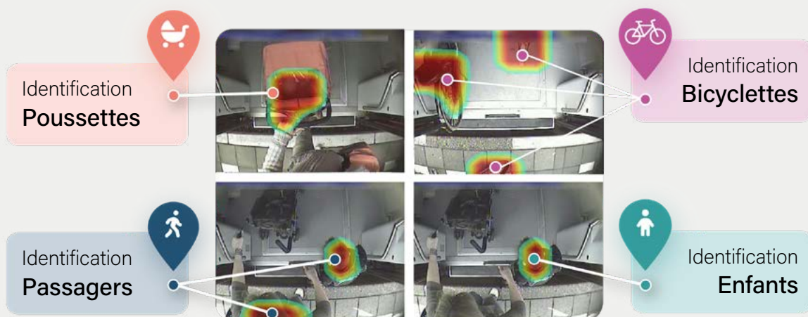
Le système de comptage des passagers basé sur l'IA différencie chaque catégorie