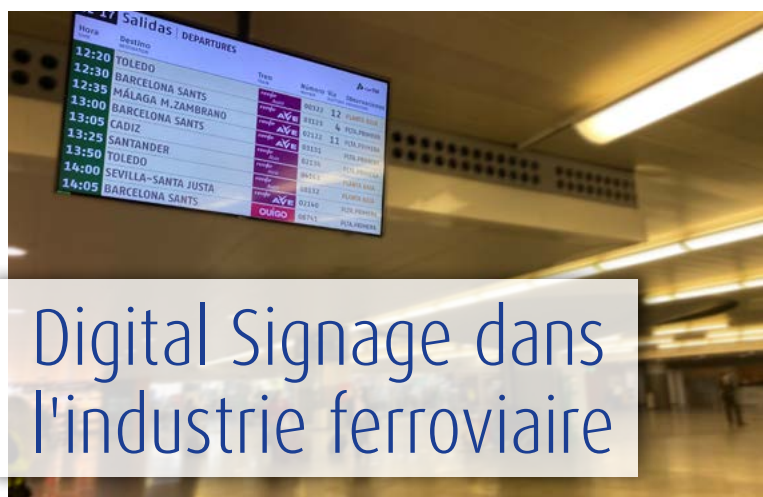
Système d'information des passagers à la gare d'Atocha à Madrid

Un autre développement de METROTENERIFE est une gaine d'isolation amovible pour les rails, qui se pose et se retire facilement, sans avoir besoin d'être démontée. Fabriquée à partir de caoutchouc de pneu recyclé, la gaine d'isolation amovible est durable et favorise l'isolation électrique et acoustique sur les quais. Le système breveté de gaine isolante a été récompensé lors des Global Light Rail Awards (2021) et des ERCI Innovation Awards (2022) décernés par l'initiative européenne des clusters ferroviaires. La solution est commercialisée par la multinationale Arcelor-Mittal.