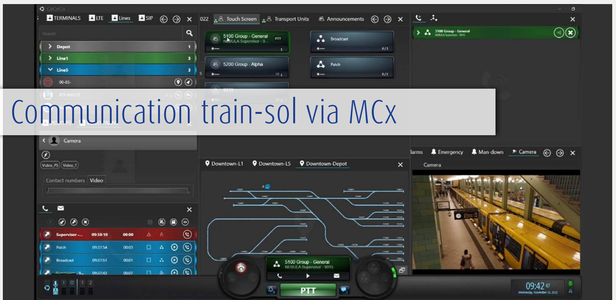
NG CeCoCo intègre la communication MCx dans la salle de contrôle avec des applications telles que la vidéo.

La numérisation du transport ferroviaire entre dans une nouvelle phase. Les dernières technologies à large bande et les solutions logicielles permettent une communication à tous les niveaux, tant du côté de l'exploitant que de l'utilisateur. L'intelligence artificielle est de plus en plus sollicitée, afin de pouvoir répondre aux exigences croissantes en matière de volume de passagers, de sécurité, de rentabilité et de confort.