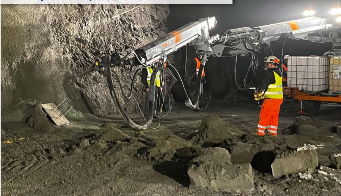
La pompe à béton projeté Mamba utilisée dans un tunnel