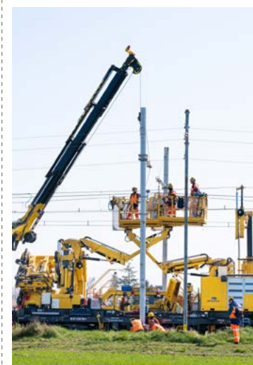
Le train TSO rénove les caténaires du réseau 1 500 volts

Les trains sont composés de différents ateliers, chacun dédié à une tâche spécifique, afin de renouveler l'infrastructure et d'améliorer les taux de production. Le train de 25 000 volts permet de remplacer en moyenne 22 supports en une seule équipe, avec un accès moyen aux voies de cinq heures et demie. C'est trois à quatre fois plus rapide qu'avec les méthodes traditionnelles. Une autre caractéristique importante de ces trains : le trafic normal peut reprendre immédiatement après la fin des travaux. Cela permet d'éviter les interruptions de trafic et les fermetures de voies pour la réalisation des travaux. En combinant mobilité et efficacité, le projet a permis d'accélérer les progrès en matière de sécurité et de qualité sur le chantier. Jusqu'à présent, 900 kilomètres de caténaires ont ainsi pu être rénovés et améliorés.