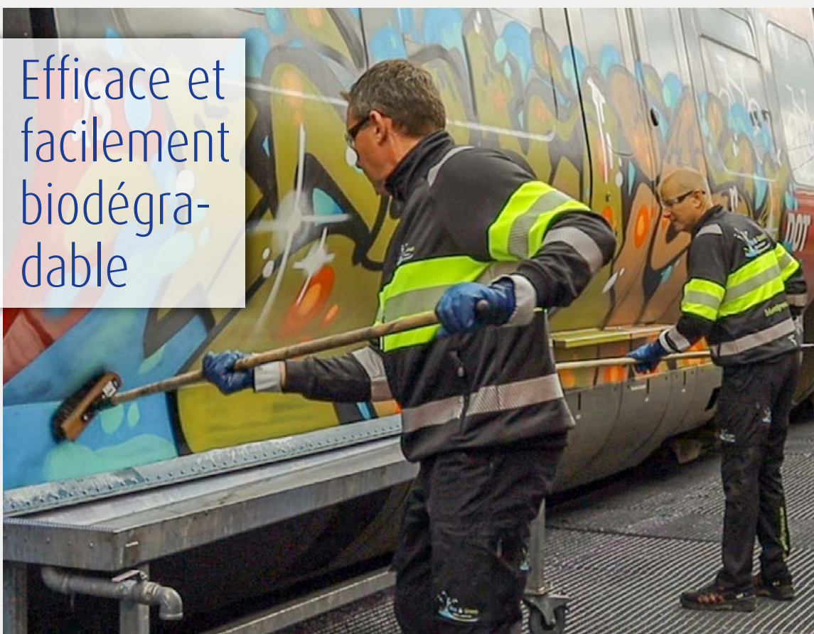
Produits sans substances nocives pour l'environnement