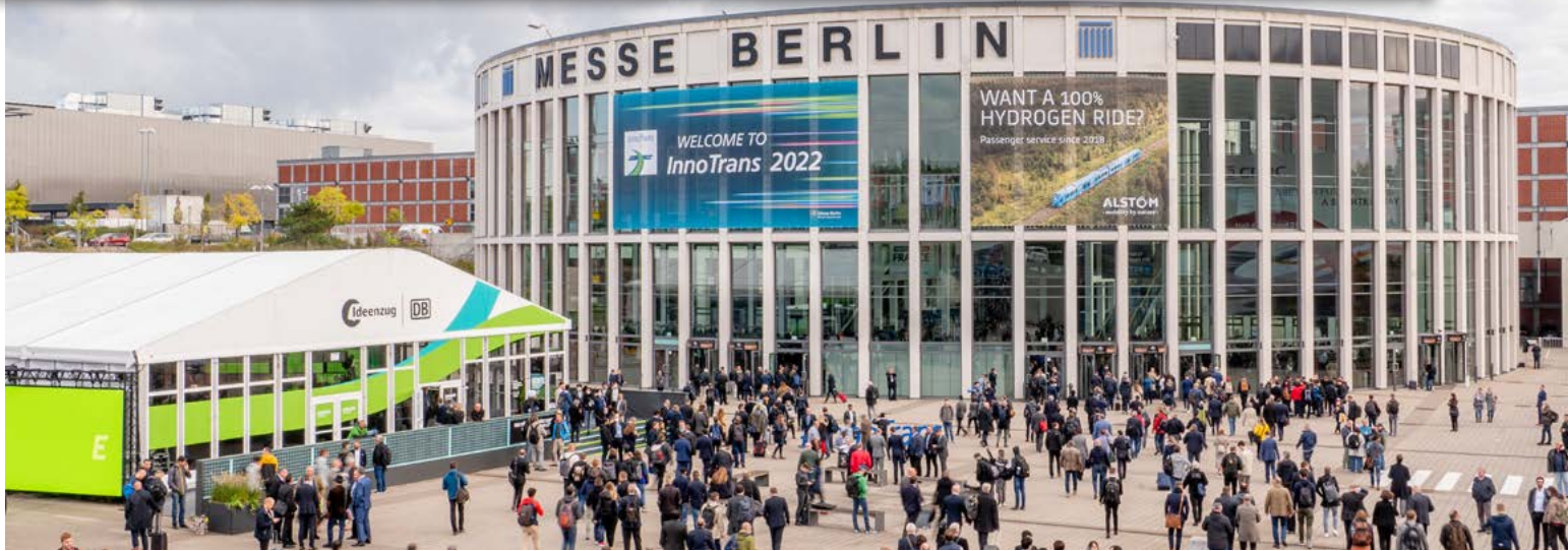
De nombreuses possibilités de réseautage et de nouveaux formats attendent les visiteurs de l'InnoTrans 2024.