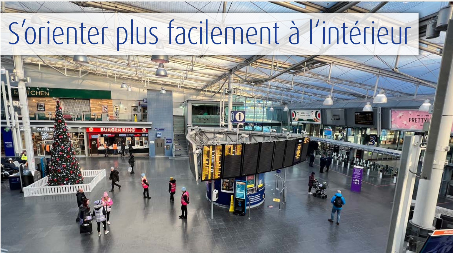
GoodMaps est disponible à la gare de Manchester Piccadilly.