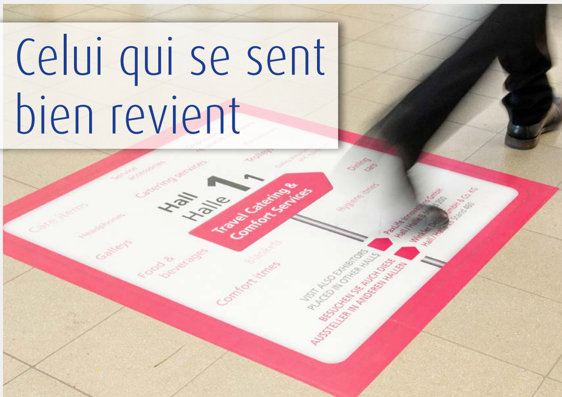
Un hall à l'InnoTrans réservé aux équipements et aux services de restauration