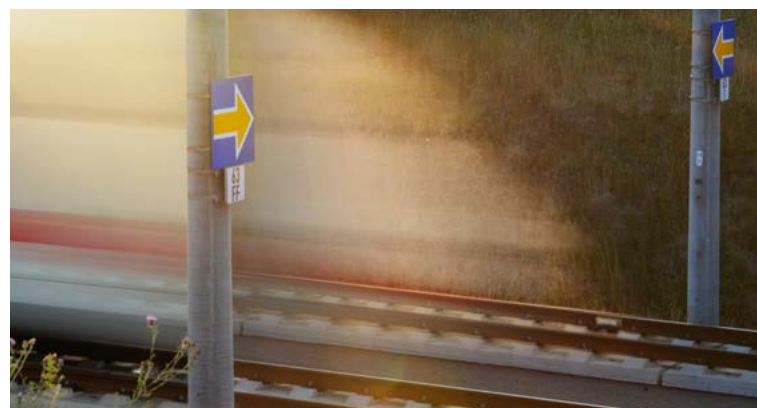
Signal ETCS : flèche jaune sur fond bleu

L'adoption du FRMCS en septembre dernier donne à l'industrie ferroviaire la possibilité de combiner les modifications et les installations nécessaires sur les véhicules et les lignes et de réduire ainsi les coûts occasionnés et les fermetures de lignes pour les mesures de construction.