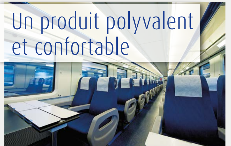
Des sièges en mousses ignifugées