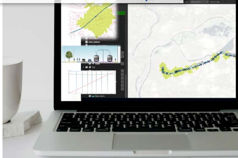
L'outil Kaplan donne une vision d'ensemble