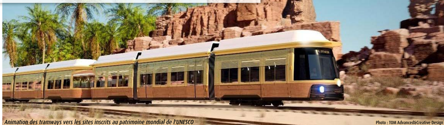
Animation des tramways vers les sites inscrits au patrimoine mondial de l'UNESCO