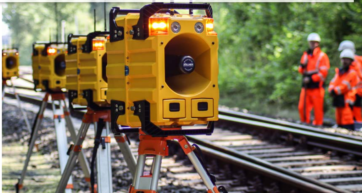
Un système automatique d'alerte sonore et lumineuse prévient de l'approche d'un train