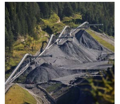
Installation de convoyeurs au tunnel de base du Brenner (décharge de Padastertal)

Le tunnel de base du Saint-Gothard, mis en service en juin 2016, a été réalisé exclusivement avec des machines de creusement Herrenknecht. Les quatre tunneliers Gripper ont commencé à creuser en 2003. Au total, ils ont pelleté environ 10,5 millions de mètres cubes de roche à travers leurs têtes de forage et ont foré plus de 85 kilomètres des tubes principaux. Ce faisant, les tunneliers ont surmonté les géologies les plus exigeantes avec différentes zones de perturbation.