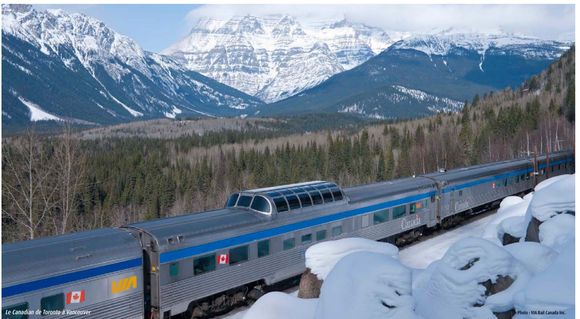
Le Canadian de Toronto à Vancouver

Vous pouvez lire l'interview complète sur le blog de l'InnoTrans.