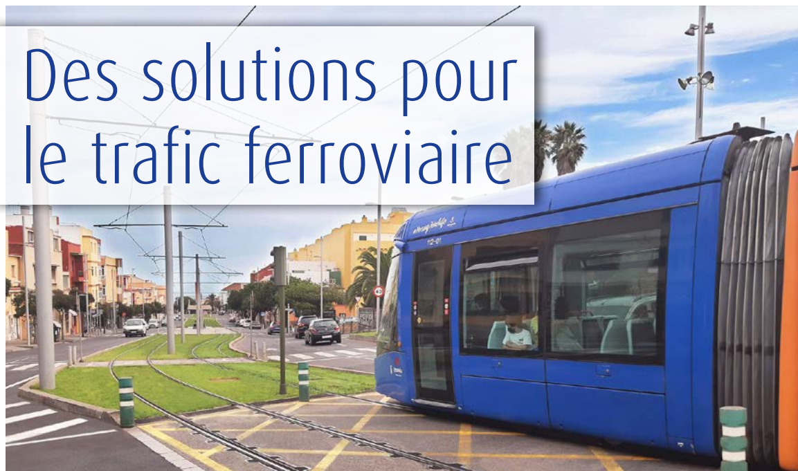
Le tramway de Ténériffe circule sur des rails dans la gaine d'isolation amovible