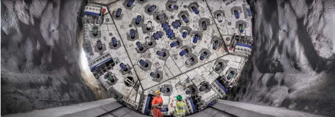
Début des travaux de percement du tunnel de base du Brenner