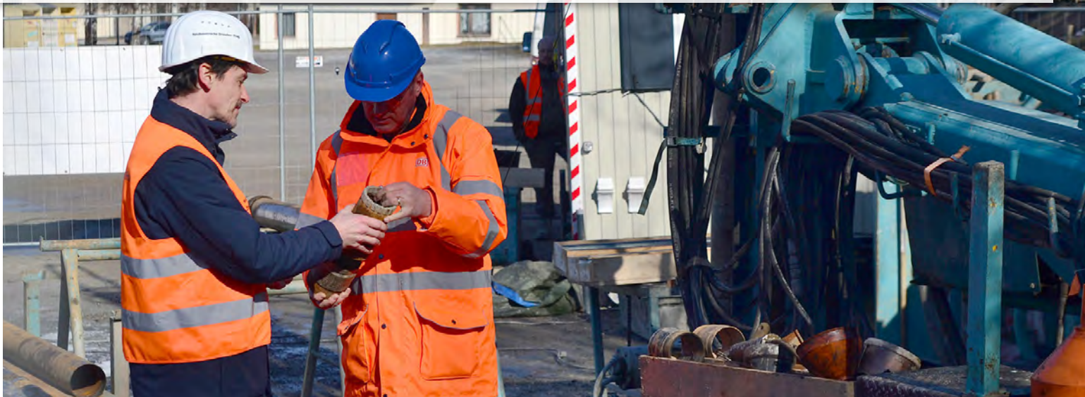
Prélèvement d'échantillons de sol pour la planification de la nouvelle ligne ferroviaire Dresde-Prague.