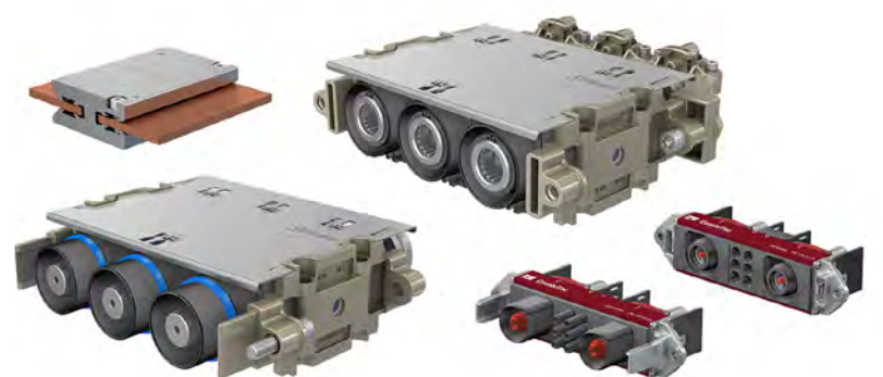
Solutions de contact pour barres conductrices et systèmes de connecteurs modulaires du groupe Stäubli pour le secteur ferroviaire.

Stäubli Electrical Connectors GmbH | Hall 12 | 350