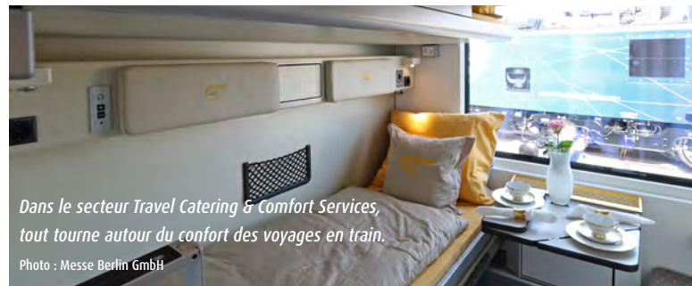
Dans le secteur Travel Catering & Comfort Services, tout tourne autour du confort des voyages en train.

passagers. Les sièges et les espaces où les passagers sont debout peuvent être, par exemple, modifiés en appuyant sur un bouton : aux heures de pointe, ces véhicules disposent de plus de places debout avec points d'appui et aux heures où il y a moins de passagers, le mode confort offre plus de places assises.