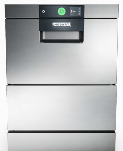
Le lave-vaisselle GPC de Hobart pour les cuisines de bord étroites.