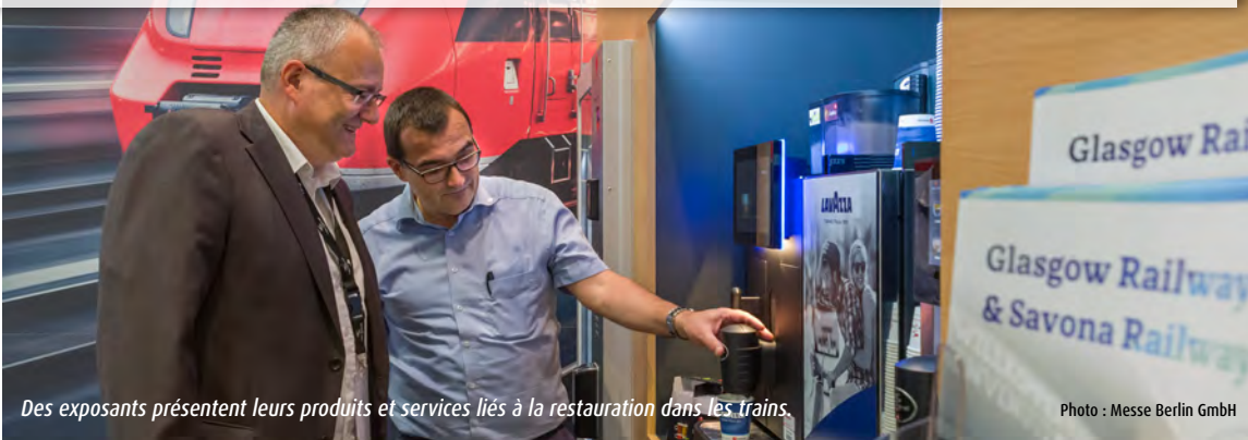
Des exposants présentent leurs produits et services liés à la restauration dans les trains.