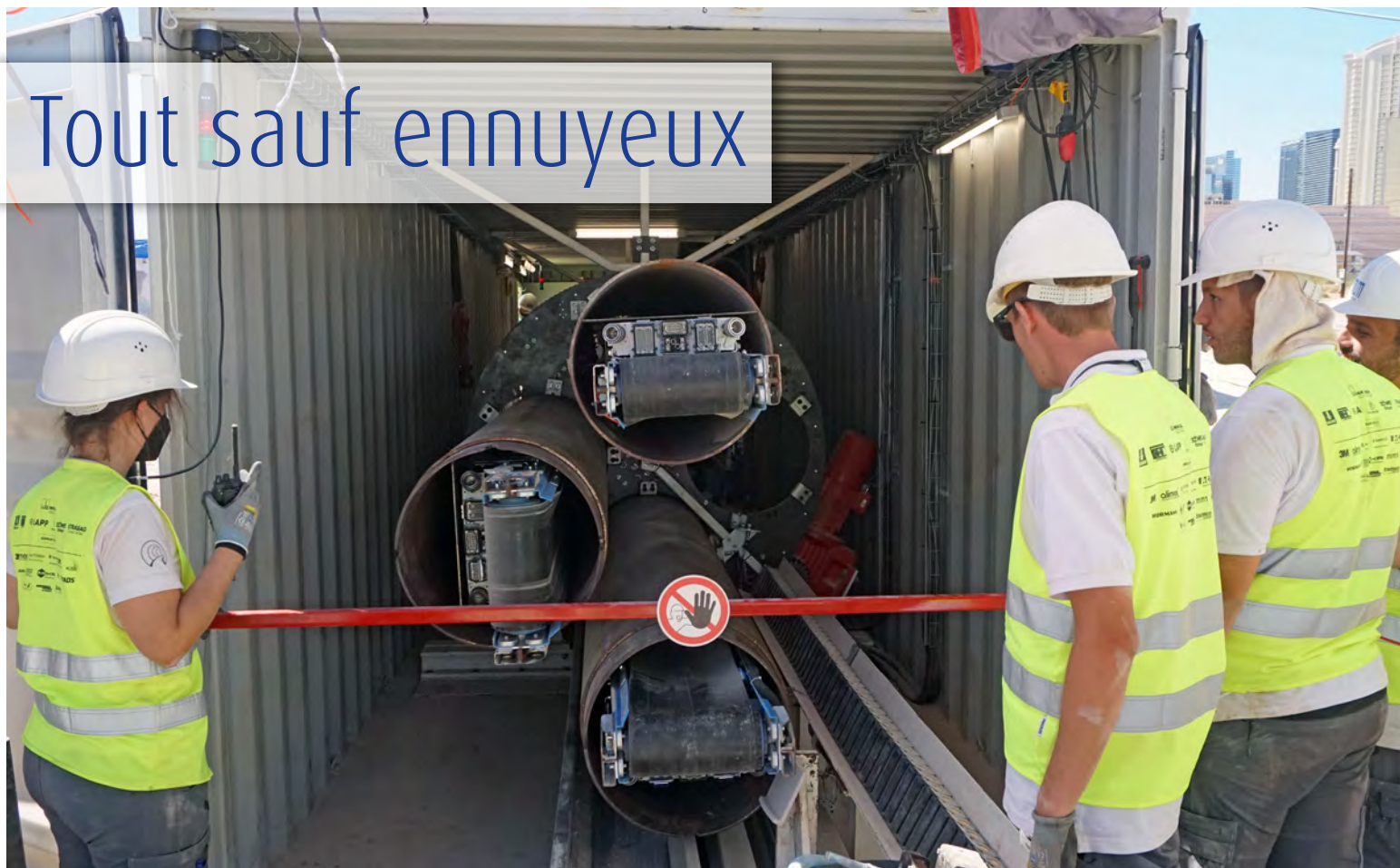
Vainqueur de la Not-A-Boring Competition 2021 à Las Vegas : TUM Boring et son tunnelier.