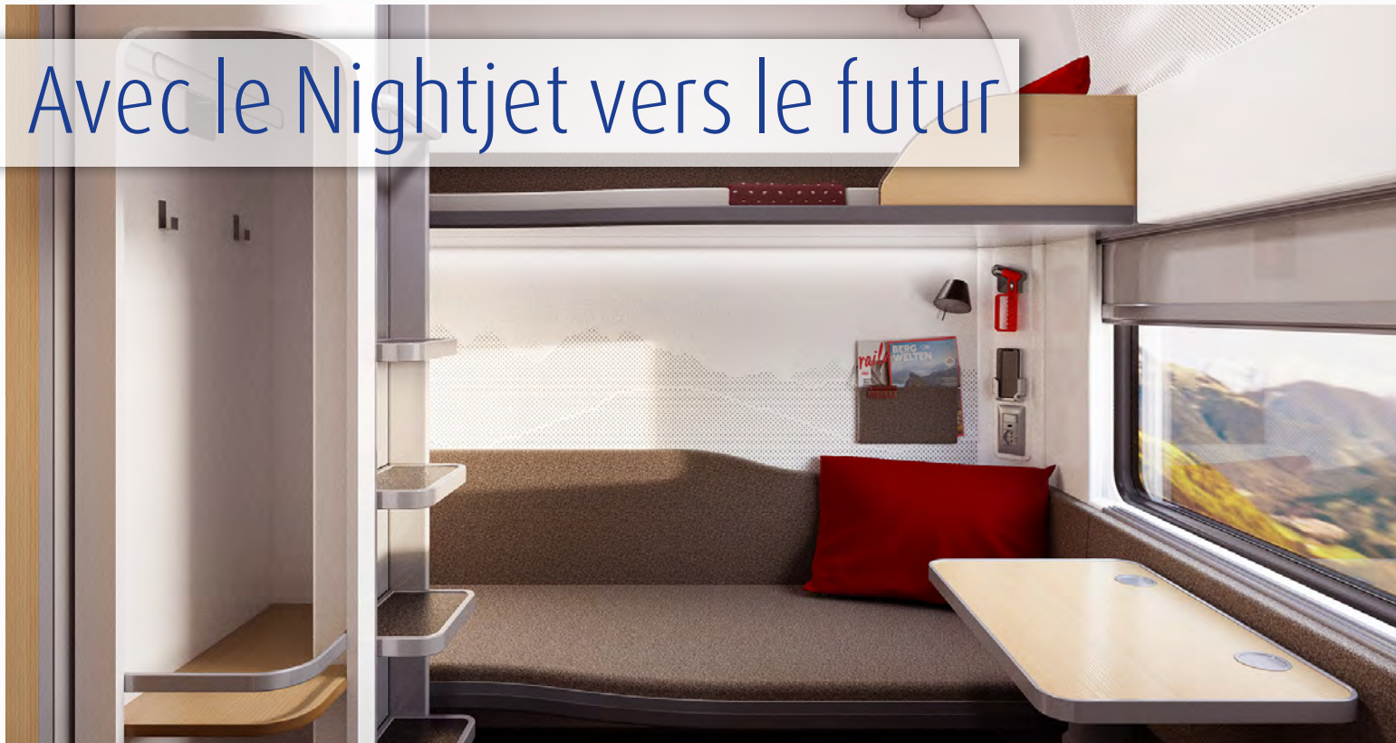
La nouvelle génération des voitures-lits du Nightjet.