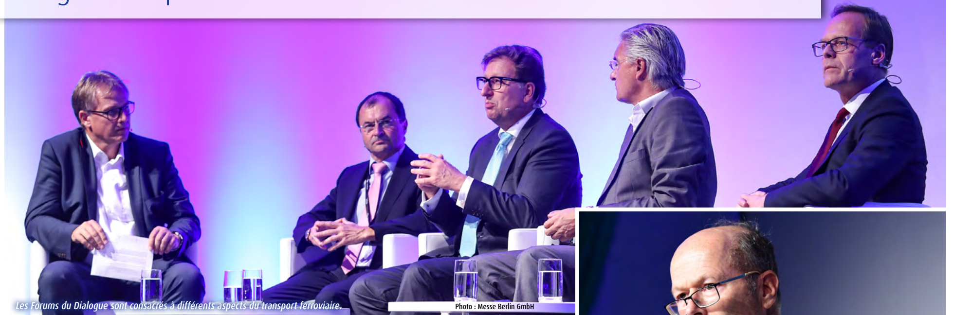
Les Forums du Dialogue sont consacrés à différents aspects du transport ferroviaire.

Programme parallèle de haut niveau avec des décideurs de renom