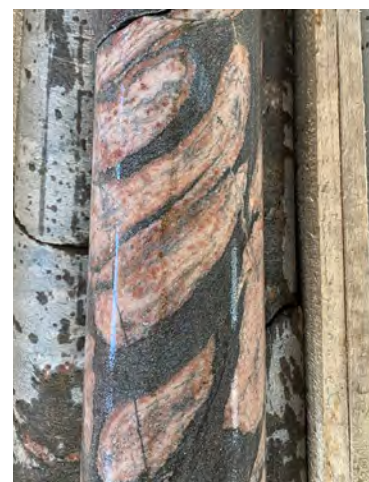
Carotte d'un échantillon prélevé à Gersdorf (Bahretal).