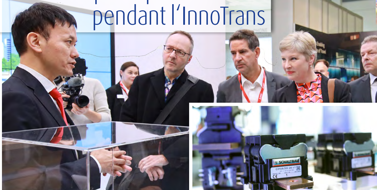
L'équipe de MES Expo fait le tour des fournisseurs d'électronique sélectionnés.