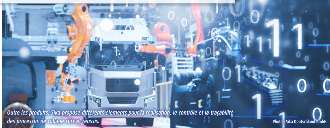
Outre les produits, Sika propose différents éléments pour la réalisation, le contrôle et la traçabilité des processus de collage sûrs et réussis.