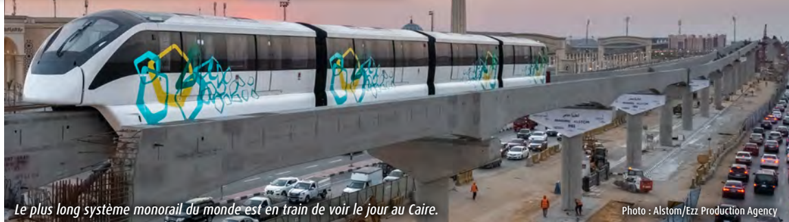
Le plus long système monorail du monde est en train de voir le jour au Caire.