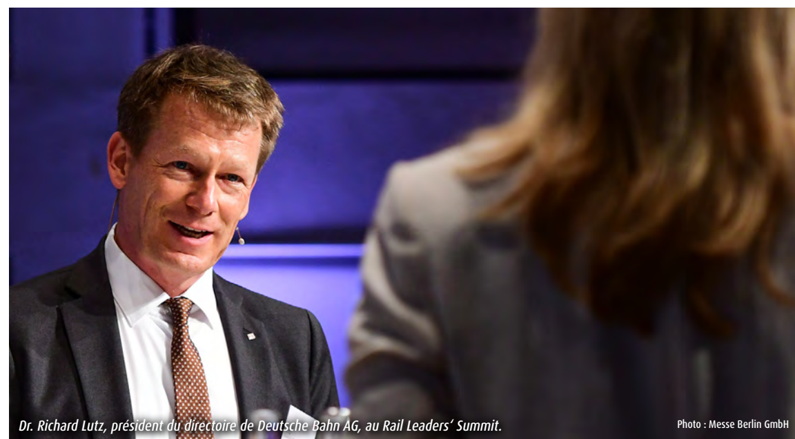
Dr. Richard Lutz, président du directoire de Deutsche Bahn AG, au Rail Leaders' Summit.

De plus amples informations sur InnoTrans Convention .